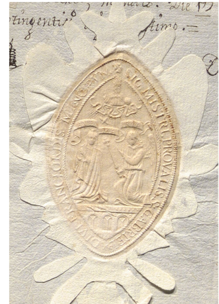
ES.10037.ADPCC / LEP 5 31-01

La autenticación documental no es un detalle accesorio, sino un elemento fundamental de la cultura escrita. Desde la arcilla mesopotámica hasta la nube digital, las sociedades han inventado métodos para distinguir lo verdadero de lo falso, lo legítimo de lo apócrifo. Cada época ha dejado sus propios signos: improntas, cera, papel timbrado, rúbricas, sellos de tinta o certificados digitales. Todos ellos conforman una larga historia en la que se entrelazan derecho, poder y confianza.