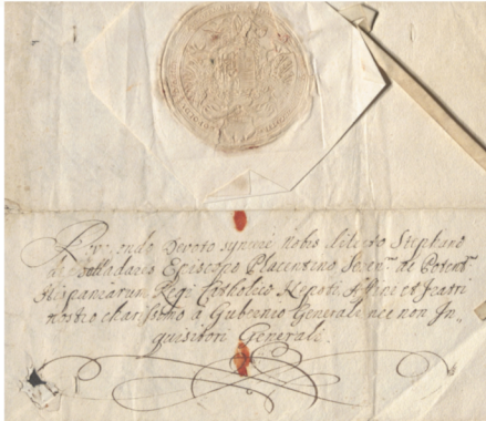
ES.10037.ADPCC / DIV 3-5