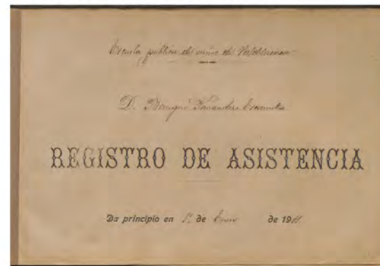
1911-1912. Valdelacasa de Tajo Registro de asistencia a la Escuela Pública de Niños. 53 hojas [210 x 310 mm.], papel. Ayuntamiento de Valdelacasa de Tajo ES.10006. AMUVCT/03.08.06/100193/003