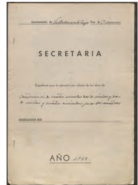
1958. Valdelacasa de Tajo Expediente de construcción de cuatro escuelas, dos de niños y dos de niñas, y cuatro viviendas para los maestros. 12 hojas [varios tamaños] y planos [540 x 300 mm.], papel. Ayuntamiento de Valdelacasa de Tajo