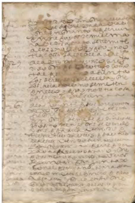
1615. Juicio de residencia.

ES.10259. AMUMRY / 01.02.07.03 // 00057 / 002