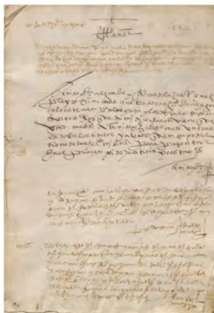
1581. Pleito sobre tierras de la dehesa boyal con el Señor de Monroy.

ES.10259. AMUMRY / 02.05.01 // 00294 / 00201