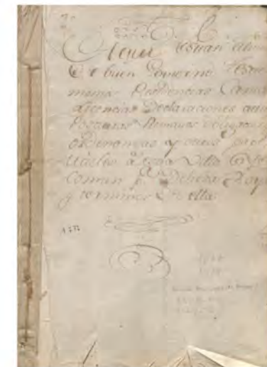
1606-1757. Expedientes de sesiones.

ES.10259 AMUMRY / 03.01.06 // 00450 / 002