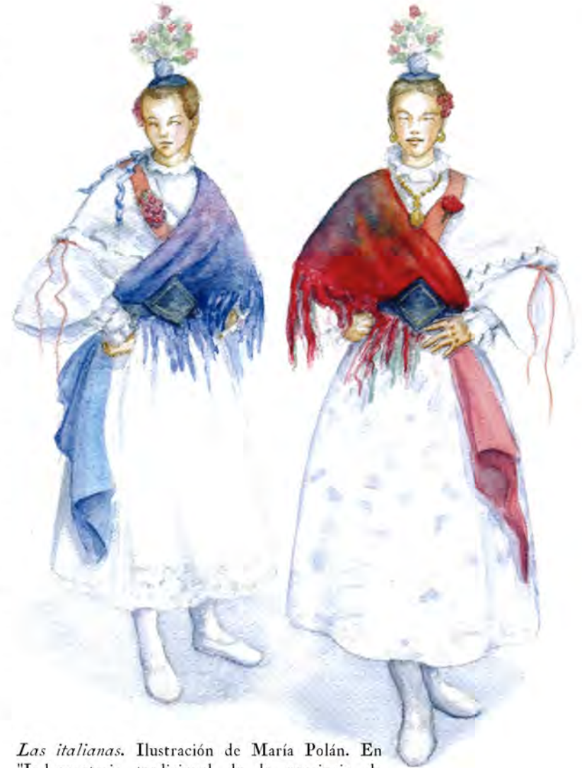
Las italianas. Ilustración de María Polán. En "Indumentaria tradicional de la provincia de Cáceres, 2008". BEX 16193