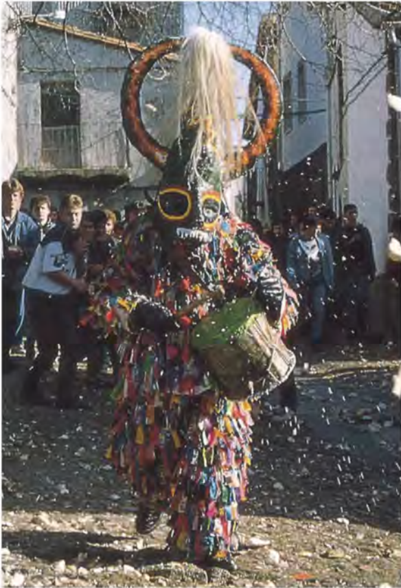
El Jarramplas. BEX 9998

Hemos hablado de algunas de las fiestas más conocidas de nuestra provincia. Sin embargo, en cada localidad hay un festejo digno de mencionarse; pedimos disculpas por no poder ponerlos todos, pero son demasiados para tan poco espacio: