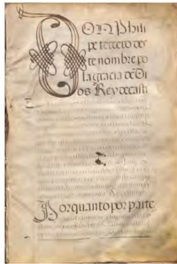
1601. Carta de privilegio y confirmación otorgada por el rey Felipe III a la villa de Portezuelo, facultándole la jurisdicción civil y criminal, alta y baja, con todo el mero y el mixto imperio. 94 hojas, [200 x 290 mm.], pergamino. Ayuntamiento de Portezuelo ES.10513. AMUPTZ/01.01.05/000002

El Archivo municipal de Portezuelo fue organizado dentro del Programa de Organización de Archivos Municipales entre 2010 y 2011. En este periodo se describieron 422 unidades de instalación, se digitalizaron 6008 imágenes. La exposición itinerante "Del arca de las tres llaves a la nube" recalca en Portezuelo. Muestra alguno de los documentos que destacan en el fondo documental ya sea por su antigüedad o por reflejar actividades y momentos particulares de la vida municipal.