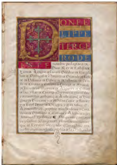
1605, diciembre, 31. Valladolid Carta de privilegio otorgada por el rey Felipe III a la villa de Portezuelo, dándole la facultad de poder elegir dos o tres regidores anuales. 17 hojas [210 x 300 mm.], pergamino. Miniados, pan de oro y colores. Ayuntamiento de Portezuelo ES.10513. AMUPTZ/01.01.05/000001

El Archivo municipal de Portezuelo fue organizado dentro del Programa de Organización de Archivos Municipales entre 2010 y 2011. En este periodo se describieron 422 unidades de instalación, se digitalizaron 6008 imágenes. La exposición itinerante "Del arca de las tres llaves a la nube" recalca en Portezuelo. Muestra alguno de los documentos que destacan en el fondo documental ya sea por su antigüedad o por reflejar actividades y momentos particulares de la vida municipal.