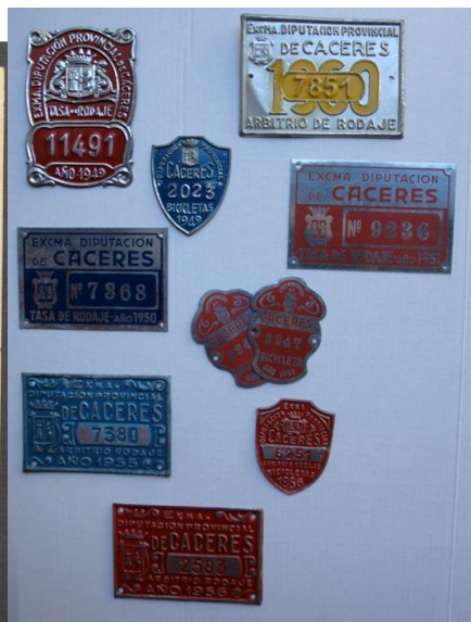
Fig. 2. Placas del impuesto de rodaje

La Diputación estuvo presente en grandes acontecimientos, como la boda del Rey Alfonso XII. Según se recoge en el acta de pleno, la Diputación pagó los gastos de la comparsa enviada por el Ayuntamiento de Montehermoso. Una pareja de aldeanos acudió en 1878 a Madrid a la boda. Para la Exposición iberoamericana que se celebró en Sevilla en 1929, la Diputación envió una serie de fotografías o documentos del Archivo procedentes de la desamortización eclesiástica del Monasterio de Guadalupe: cartas de los reyes de la Casa de Borbón (desde Felipe V a Carlos IV), cartas de magnates y ministros (S. XVI-XVII), provisiones reales y privilegios, etc.