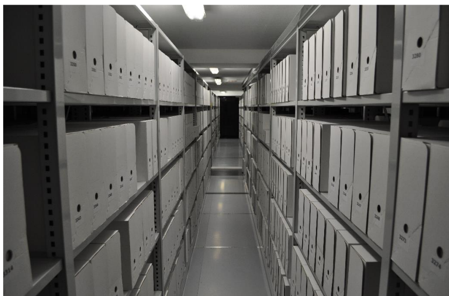
Fig. 5. Depósito Pintores, 10

A lo largo de su historia, el Archivo ha tenido varios emplazamientos. De su ubicación en los bajos del palacio de la Diputación, se pasó, a partir de 1980, al Complejo Cultural "San Francisco" 8