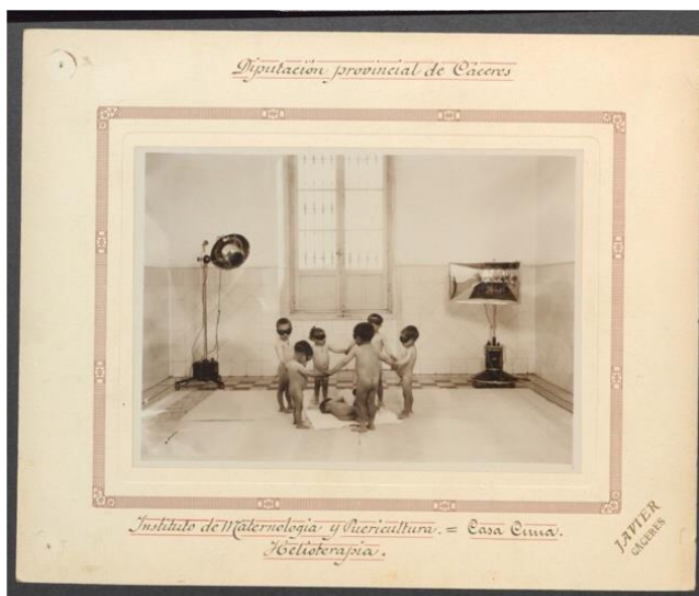
Fig. 1 Sala de Helioterapia de la Casa Cuna