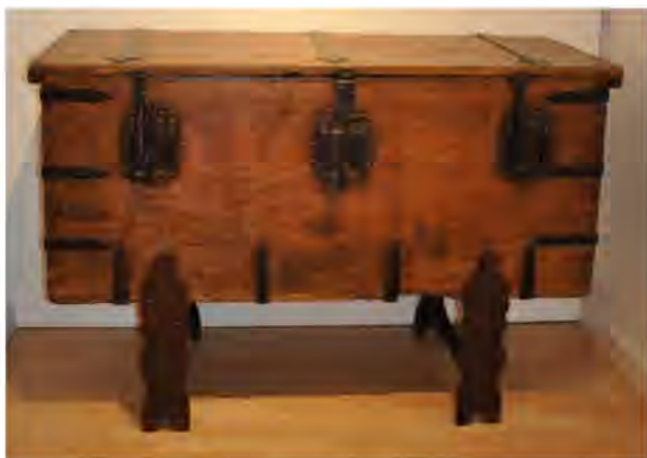
Arca de las tres llaves. Archivo Diocesano Coria-Cáceres.

El archivo municipal de Casar de Cáceres fue organizado dentro del Programa de Organización de Archivos Municipales durante diciembre de 2009 y octubre de 2010. En este período se describieron 1228 unidades de instalación y se digitalizaron 27.281 imágenes.