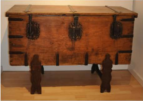
Arca de las tres llaves. Archivo Diocesano Coria-Cáceres.

El Archivo municipal de Guadalupe fue organizado dentro del Programa de Organización de Archivos Municipales durante julio de 2013 y junio de 2014. En este periodo se describieron 1.534 unidades de instalación y se digitalizaron 18.813 imágenes.