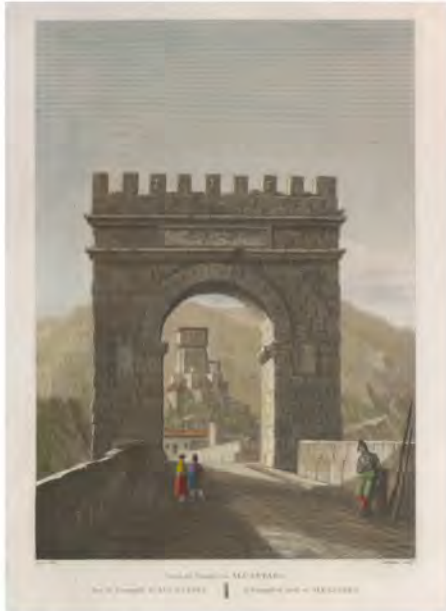
Laborde. Arco de Triunfo sobre el puente de Alcántara (1820). ES.10037.ADPCC/04.GRAB.55/13