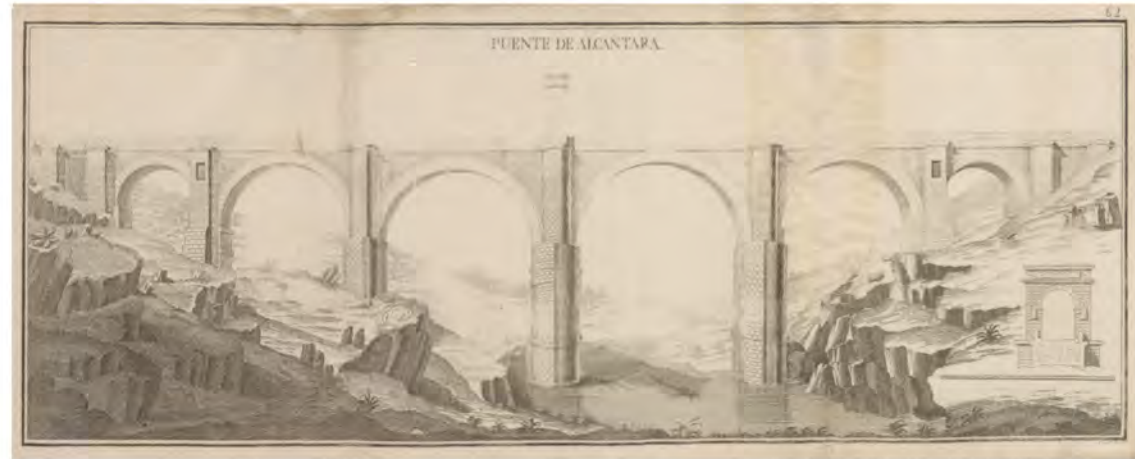
Antonio Ponz. Puente de Alcántara (1784). S.10037.ADPCC/04.GRAB.55/248

2. m. Suelo que se hace poniendo tablas sobre barcas, odres u otros cuerpos flotantes, para pasar un río.