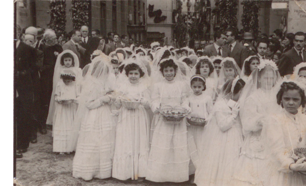
Procesión del Corpus con niñas vestidas de primera comunión (Caldera, Cáceres, 1952) 50FOT_02330