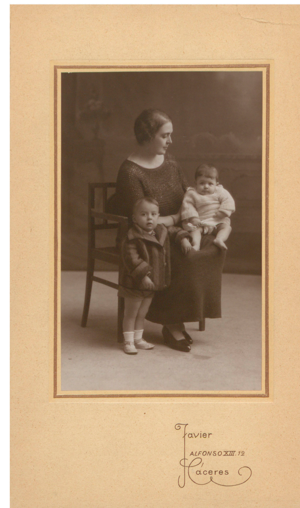
Madre con sus hijos (Javier, Cáceres, s. f.) 50FOT_02389