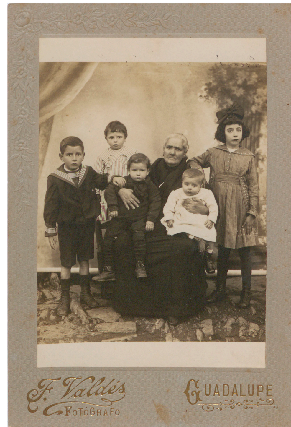
Abuela con sus nietos (F. Valdés, Guadalupe, s. f.) 50FOT_02302