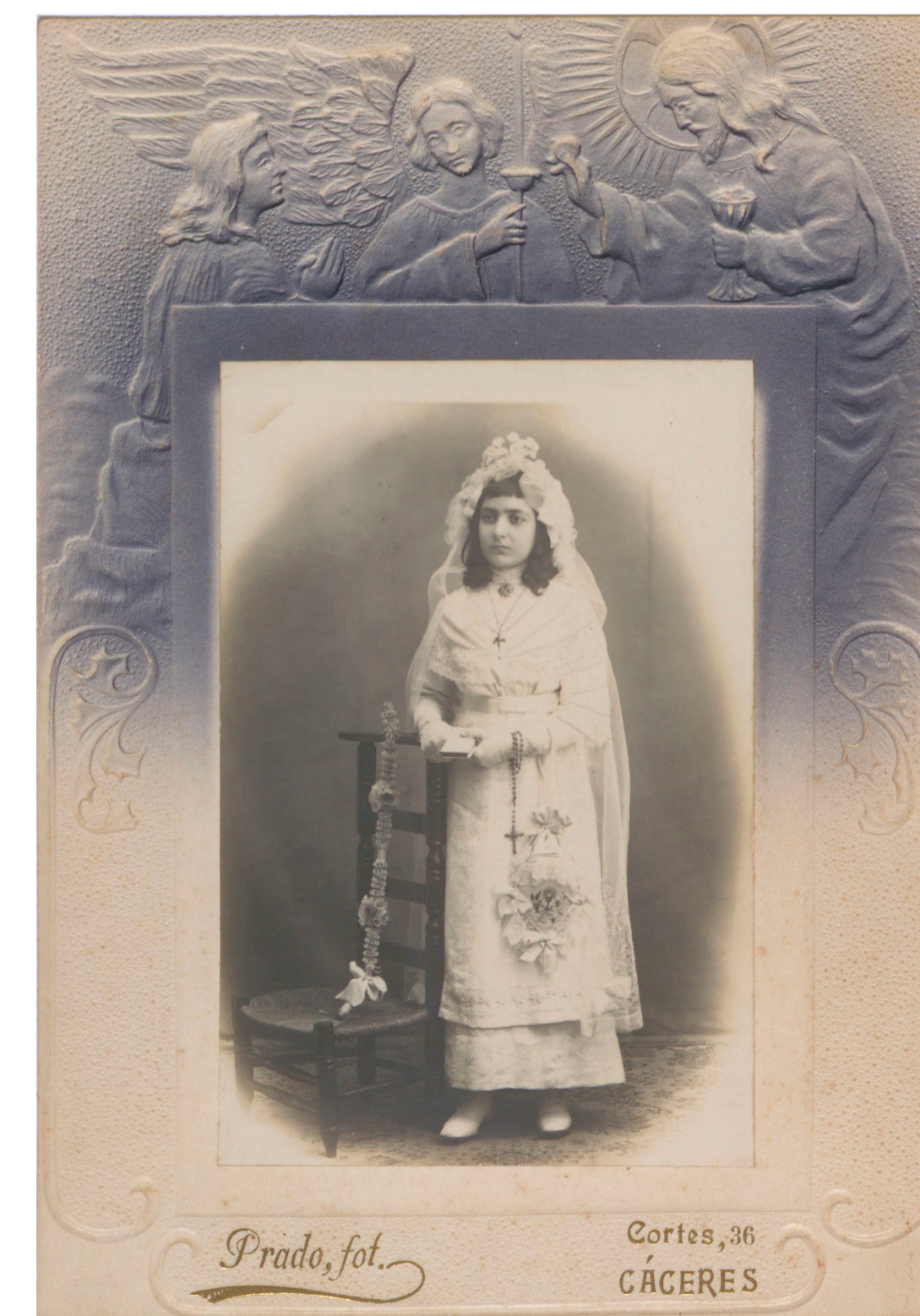
Niña de primera comunión (Prado, Cáceres, s. f.) 50FOT_02284