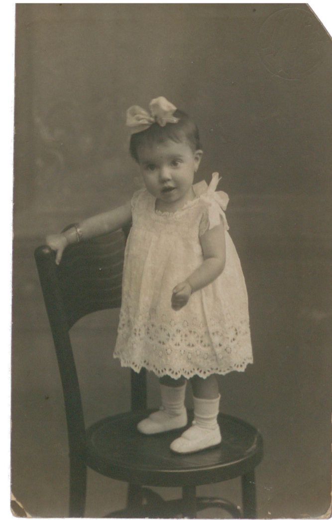
Niña sobre una silla (Javier, Cáceres, 1927) 50FOT_02359

Los niños no se están quietos. ¿Cómo conseguir que mantengan una pose cuando la cámara necesita unos segundos de exposición? Cuántas fotografías se habrán tenido que repetir porque se ha movido una mano que luego saldrá borrosa, porque en el último segundo se ha cambiado la expresión. Sin quitarle méritos a ningún otro, uno de los mejores fotógrafos de niños que hemos tenido es Javier García Téllez. ¡Cuánto debió de sufrir la madre de la pequeña subida a la silla sin nadie sujetándola! Y esas otras dos, tomadas de la mano... Muchos recordarán aún a Caldera, con el burrito de peluche en Cánovas para hacer una foto de recuerdo. Y los fotógrafos de pueblo, con su oficio también, con el fondo de cortinas, el enorme ciervo de juguete, la frase tantas veces repetida: ¡Mira el pajarito!