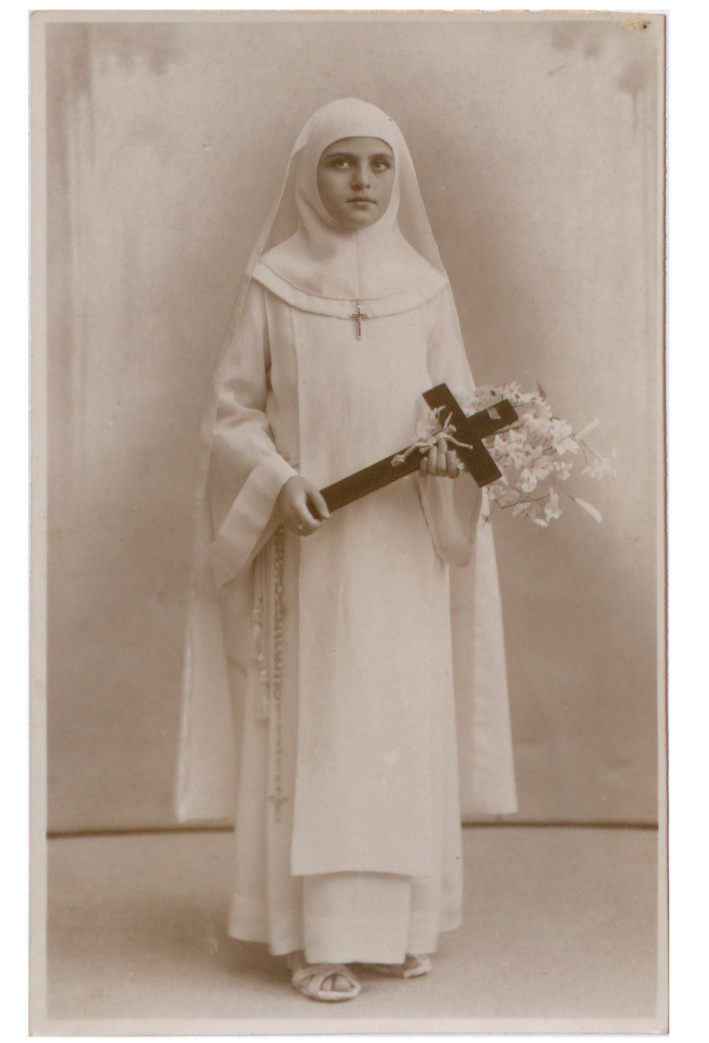
Niña de primera comunión (Javier, Cáceres, s. f.) 50FOT_02345