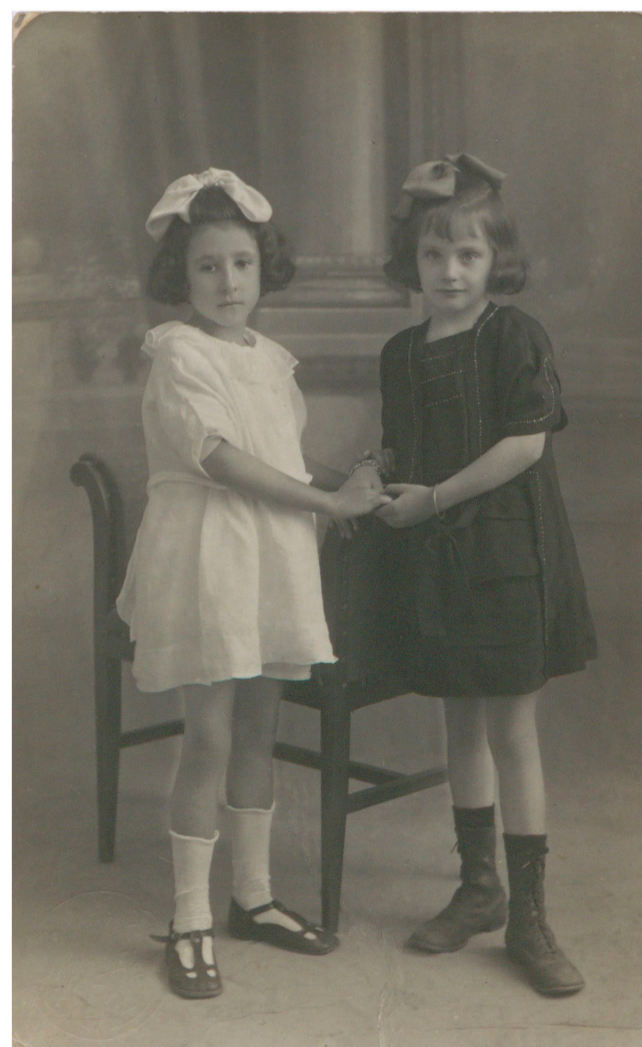
Dos niñas tomadas de la mano (Javier, Cáceres, s. f.) 50FOT_02347