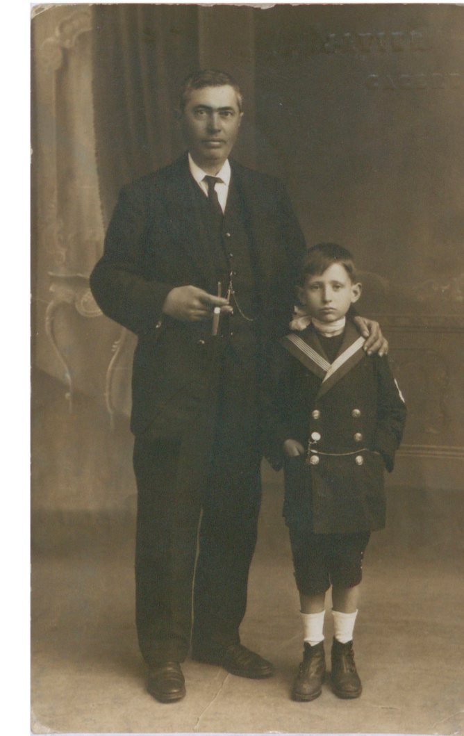
Niño de primera comunión con su padre (Javier, Cáceres, s. f.) 50FOT_02356

Los niños no se están quietos. ¿Cómo conseguir que mantengan una pose cuando la cámara necesita unos segundos de exposición? Cuántas fotografías se habrán tenido que repetir porque se ha movido una mano que luego saldrá borrosa, porque en el último segundo se ha cambiado la expresión. Sin quitarle méritos a ningún otro, uno de los mejores fotógrafos de niños que hemos tenido es Javier García Téllez. ¡Cuánto debió de sufrir la madre de la pequeña subida a la silla sin nadie sujetándola! Y esas otras dos, tomadas de la mano... Muchos recordarán aún a Caldera, con el burrito de peluche en Cánovas para hacer una foto de recuerdo. Y los fotógrafos de pueblo, con su oficio también, con el fondo de cortinas, el enorme ciervo de juguete, la frase tantas veces repetida: ¡Mira el pajarito!