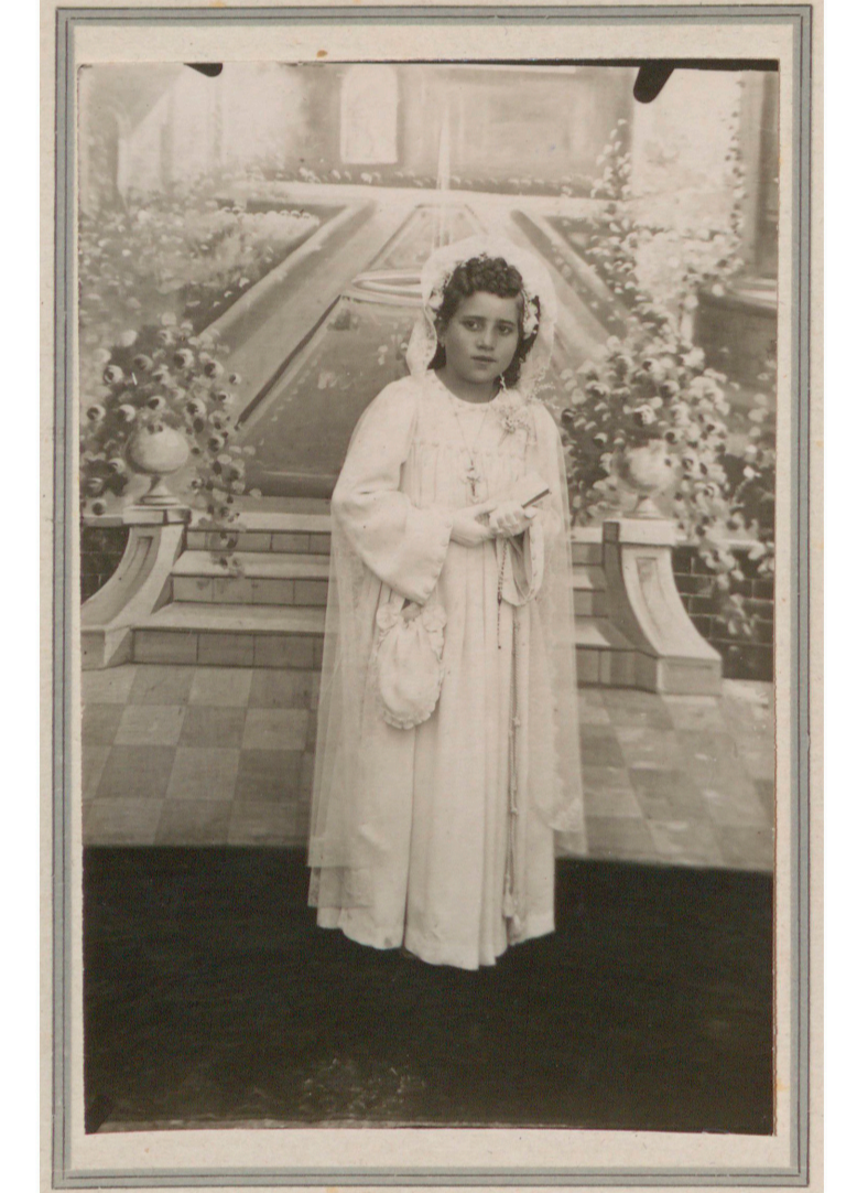
Niña de primera comunión (Anónimo, Torremocha, 1949) 50FOT_02300