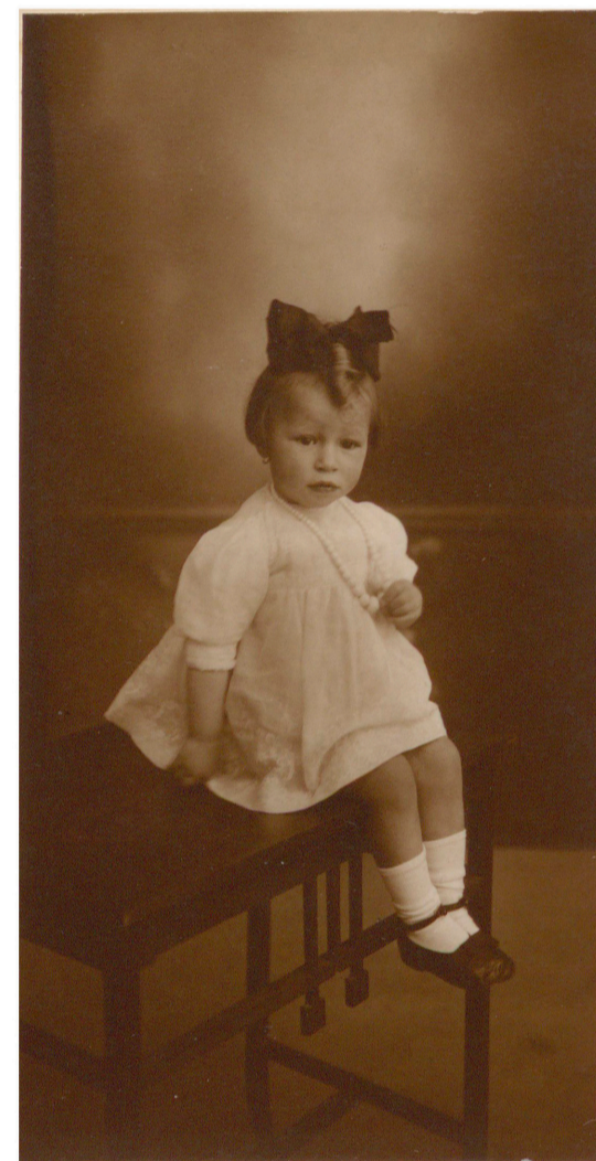
Niña sentada con flor en la mano (Soc. Artístico-Fotográfica, Cáceres, s. f.) 50FOT_02325