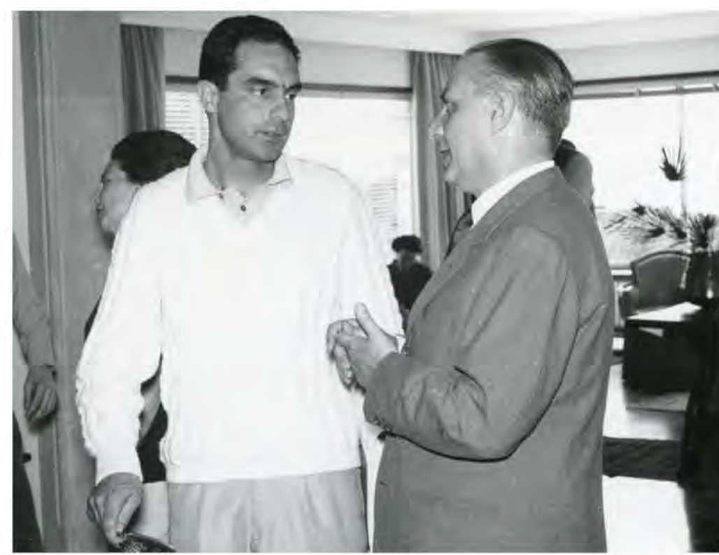
Italo Calvino. ES.10037-ADPCC/04.02.50.08//AFRI/C/16/47