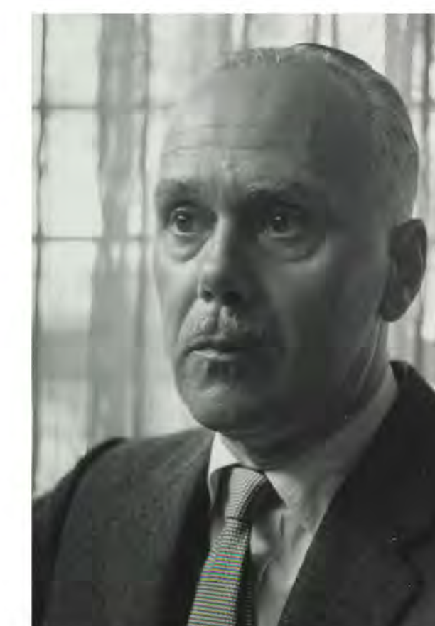
Luis Cernuda.