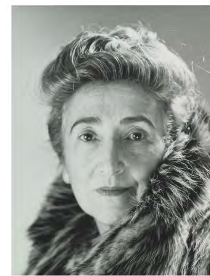
Rosa Chacel.