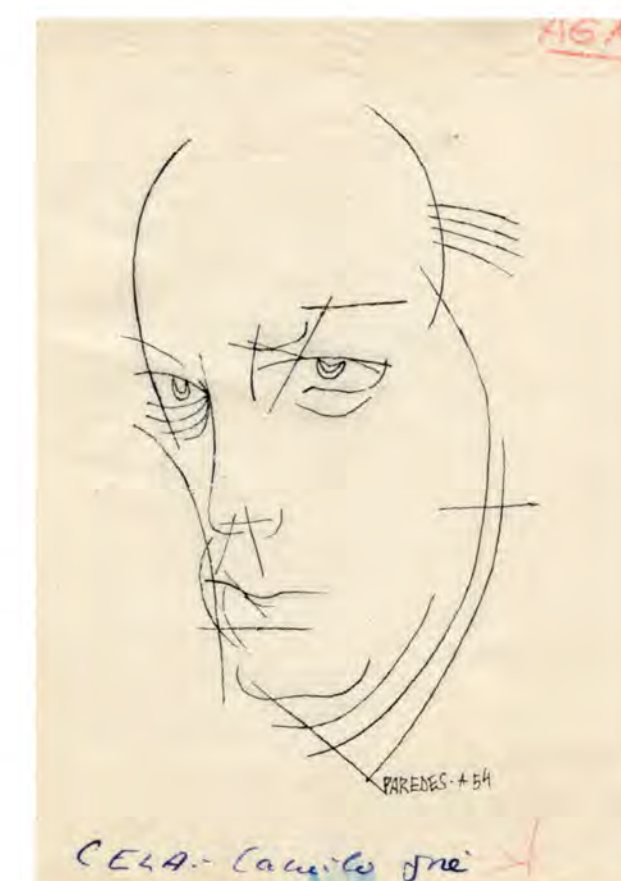
Camilo José Cela (Caricatura de Paredes). ES.10037-ADPCC/04.03.55//GRA/C/7/40