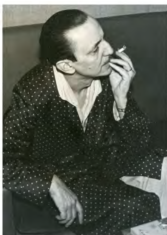
Antonio Buero Vallejo.