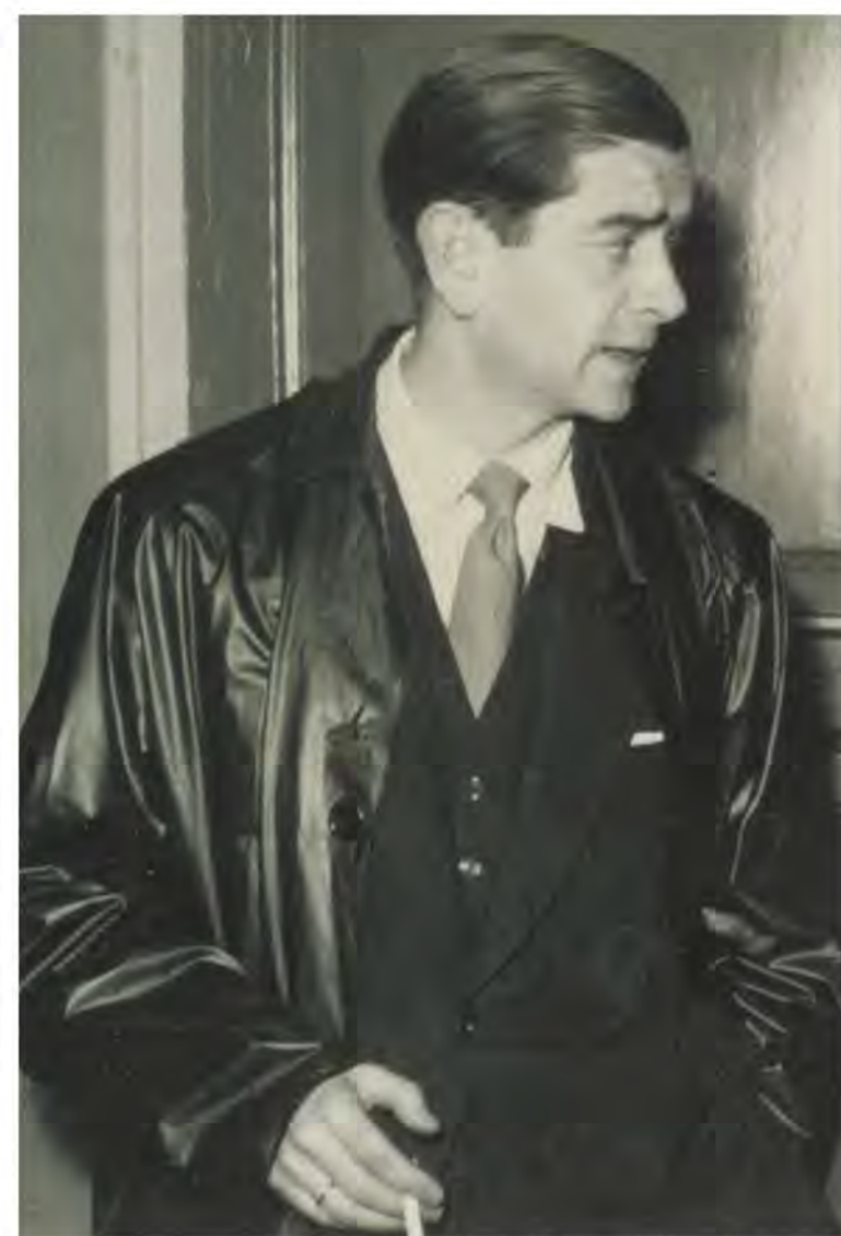
Ignacio Aldecoa.