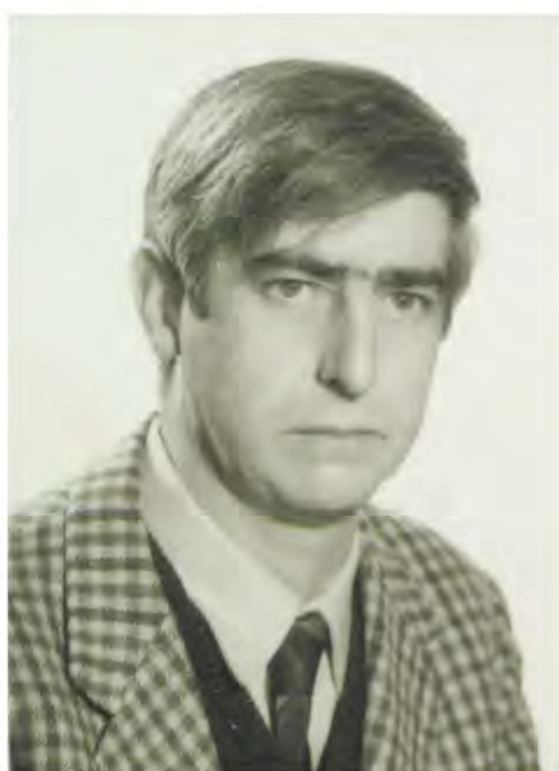
Juan Benet.