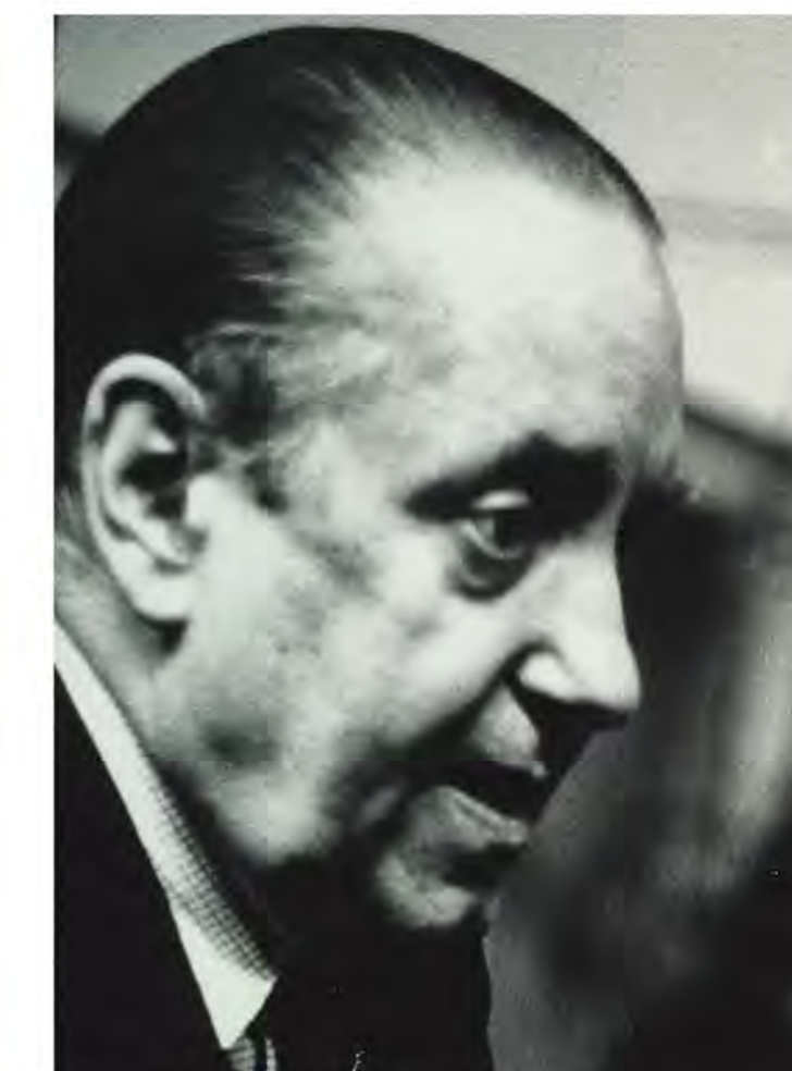
Alejo Carpentier. ES.10037-ADPCC/04.02.50.08//AFRI/A-G/7/22