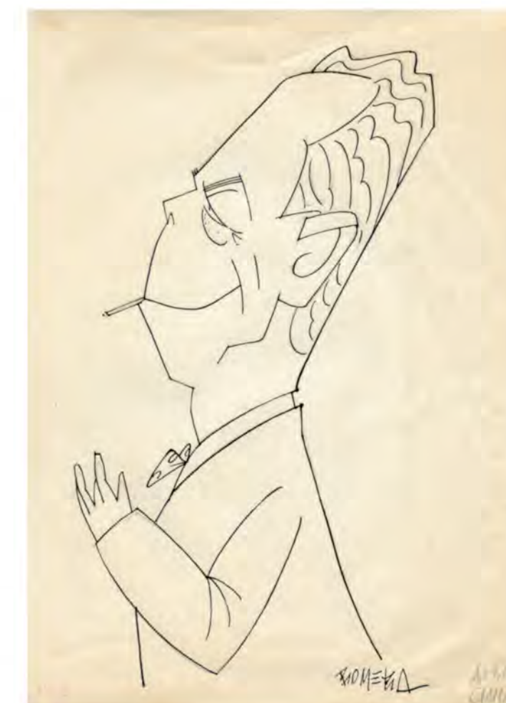
Albert Camus (Caricatura de Romera). ES.10037-ADPCC/04.03.55//GRA/C/7/44