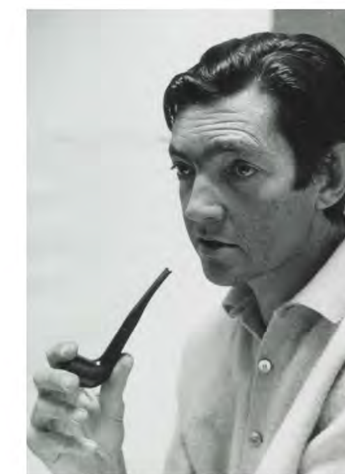
Julio Cortázar. ES.10037-ADPCC/04.02.50.08//AFRI/A-G/8/2