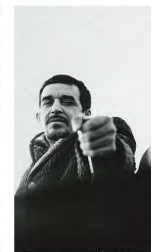
Gabriel García Márquez. ES.10037-ADPCC/04.02.50.08//AFRI/A-G/20/44