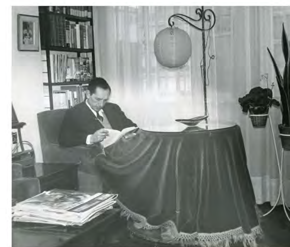
Miguel Delibes. ES.10037-ADPCC/04.02.50.08//AFRI/C/10/39