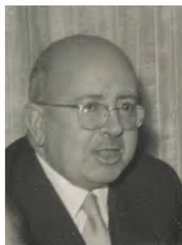
Dámaso Alonso. ES.10037-ADPCC/04.02.50.08//AFRI/A-2/alonso/33