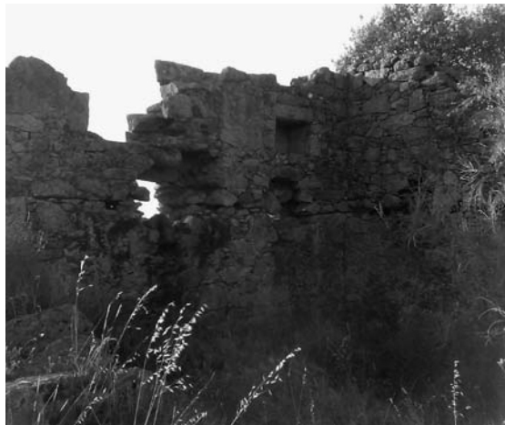
El convento franciscano de los Arcabuces.

en 1671 y según las provisiones reales en los primeros años del siglo XVI y Facultad de Fernando el Católico para que el Concejo de Trujillo pueda dar al guardián del convento de San Francisco 50.000 marvedís para comprar el solar de la Iglesia y Huerta de dicho convento. En Segovia a 21 de agosto de 1505 22 .