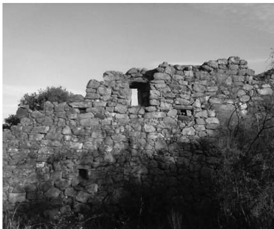
El convento franciscano de los Arcabuces.

descalzos 17 . Además, un dato importante, en los mojanos cercanos se conservan restos de molduras con el típico cordón franciscano.