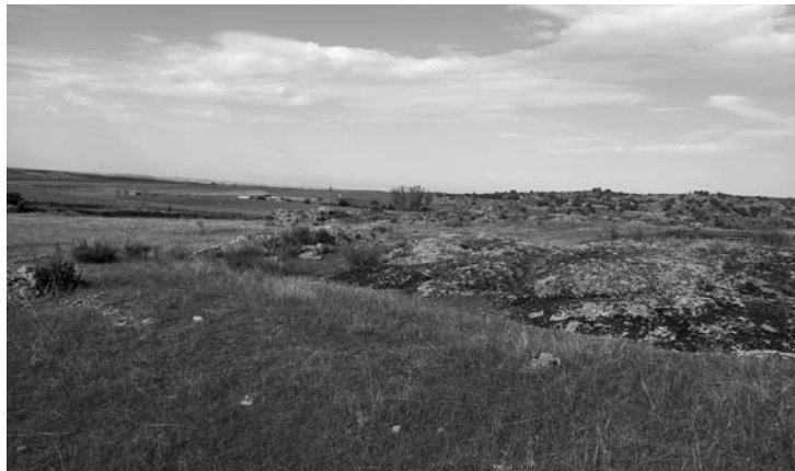
El territorio, El Cercal.

entre los 25° y los 40°. En esa superficie se observa una acanaladura, que mide 30 cm de ancho, que es la huella del desgaste por roce producida al haberse resbalado miles de veces por esa superficie de la peña. Esta acanaladura es el elemento que caracteriza las “peñas resbaladeras”, pues permite identificar el rito practicado en ellas, para el que se aprovecha la altura y la inclinación de la pared, cuyo uso prolongado ha producido esa acanaladura. Este tipo de peñas está relacionado con un rito de fecundidad que antiguamente practicaban las mujeres para casarse o para tener hijos.