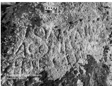
Detalle de la inscripción romana (foto Pérez Solís).

Trujillo y su territorio es el antiguo Turgalium romano, nombre de raíz celta. Es la denominación latina del topónimo correspondiente al primitivo castro indígena. Los diferentes testimonios epigráficos y funerarios son prueba fehaciente que la Turgalium prerromana se convirtió, durante la ocupación romana, en una prefectura de cierta importancia, al igual que lo fue Montánchez como cabeza de la prefectura Mullicensis que junto a la de Mérida formaban los tres grupos del municipio romano. Augusto integra Turgalium en la nueva capital de Lusitania como prefectura.