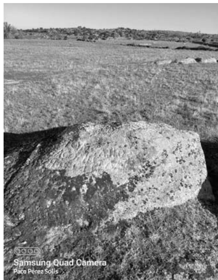
Afloramiento granítico con epígrafe romano.

queda atestiguada por numerosos epígrafes localizados en el término municipal de Trujillo. A partir del año 69, Vespasiano dio un gran paso en el proceso de romanización al conceder el derecho de ciudadanía latina a todos los habitantes de la Península Ibérica, facilitando de este modo el que los hispanos pudieran acceder a un cargo público. En el siglo III d. C. los germánicos saquearon la provincia a su paso, algunas ciudades fueron fortificadas con murallas. La fortaleza turgaliense como podemos observar por su cimentación ciclópea ya existía en épocas prerromanas, con la Pax de Augusto se restaura el viejo oppidum. En el siglo IV el Anónimo de Ravena 5 cita a Trujillo como Turcalion ; en el Itinerario de Antonino de Mérida a Zaragoza por Toledo: Mérida, Lacipea, Rodacis, Turcalion, Lomundo, Augustobriga, Lebuna y Toletum. Esta vía no pasaba por Jaraicejo al puerto de Miravete (camino creado por los árabes para unir Trujillo con Albalat en el Tajo).