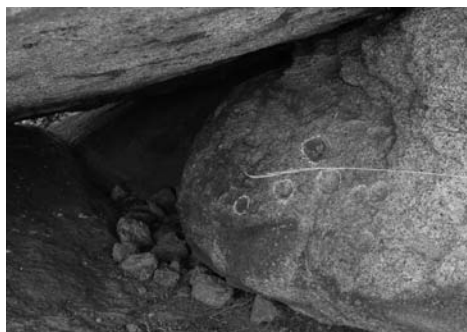
Abrigo con cazoletas.

Este territorio perteneció a la provincia de Roma conocida como Lusitania, desde que finalizaron las guerras lusitanas, cuya capital era Emérita Augusta (Mérida), que se fundó en el año 25 a.C, sobre el río Anas. Desde aquí partían calzadas importantes, por ejemplo la que iba hacia Toletum (Toledo) pasando por Turgalium . Según manifestaciones del padre Fidel Fita y estando de acuerdo con él, es probable que los antiguos habitantes de Turgalium pactasen con los romanos, no llegando de esta forma a luchar contra ellos. Los romanos respetarían la primitiva población indígena, romanizándola después, y gozando de esta forma de los favores del pueblo invasor, por tanto si esto sucedió así Turgalium sería una de las ciudades federadas de la Hispania.