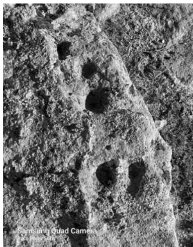
Detalle de las cazoletas.