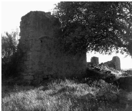
El convento franciscano de los Arcabuces.