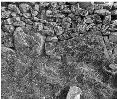
Restos de ortostatos.

era magnífica: el nuevo Convento estaba ciertamente sin habitar como recién terminado, pero no se hace ninguna mención de él; conseguido el permiso, el Concejo, Gobernador y el pueblo en pleno pedirían que fuesen Observantes los frailes que llegaran, y de este modo la tentativa de los nobles placentinos y de Fray Pedro quedaría sin efecto.