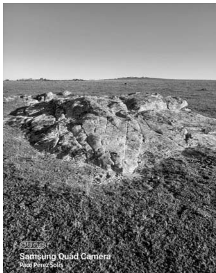
Detalle del afloramiento granítico.