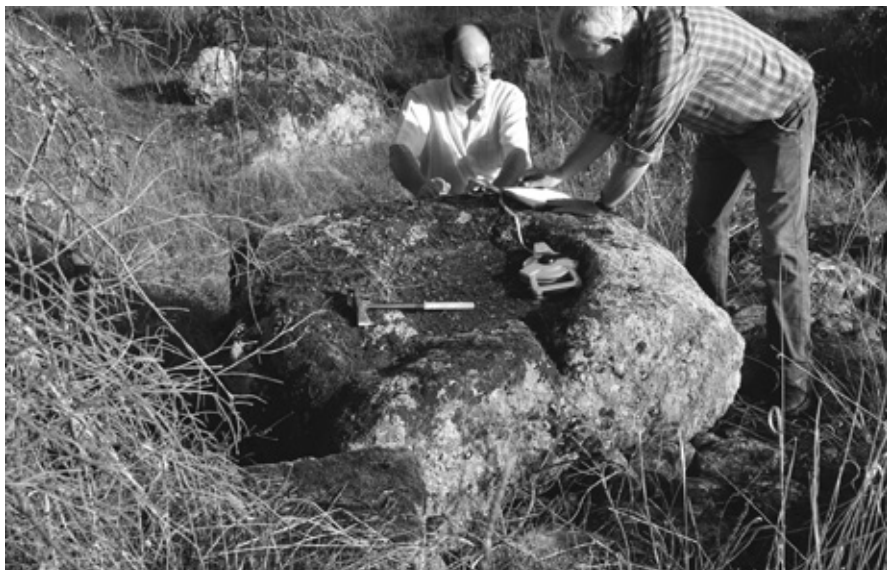
Midiendo el altar de sacrificios.