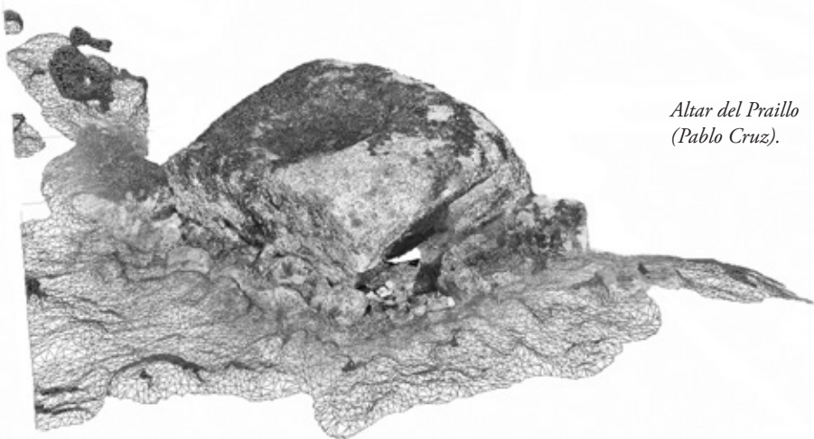
Altar del Praillo (Pablo Cruz).

de cabeza ligeramente apuntada y en torno a su cintura hay una serie de pequeñas puntuaciones indicadoras de que el personaje portaba lo que parece ser un objeto punzante alargado. Formal y temáticamente el conjunto presenta similitudes con las pinturas esquemáticas de Malpartida de Cáceres, Torrejón el Rubio y los conjuntos pictóricos de La Burra y El Joyu en Cañamero, que situamos en las cercanías del Calcolítico Final o en los comienzos del Bronce 11 .