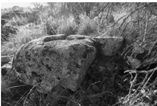
Altar de sacrificios.

Aún se percibe un antropomorfo en tonalidad rojo vinoso al lado de otra figura humana en posición vertical que porta en una de sus extremidades una especie de arco. Tanto la representación de la figura humana como el arma nos han llegado bastante desgastadas y con trazados intermitentes. A la izquierda de la representación esquemática humana de lado derecho, se aprecian unos trazos de difícil interpretación. El conjunto continúa hacia la parte superior, donde se percibe un trazo de tendencia horizontal, ligeramente arqueado, cóncavo en la parte inferior. Se trata de un ancoriforme