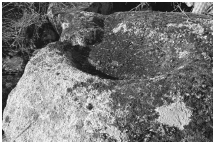
Detalle del ara.