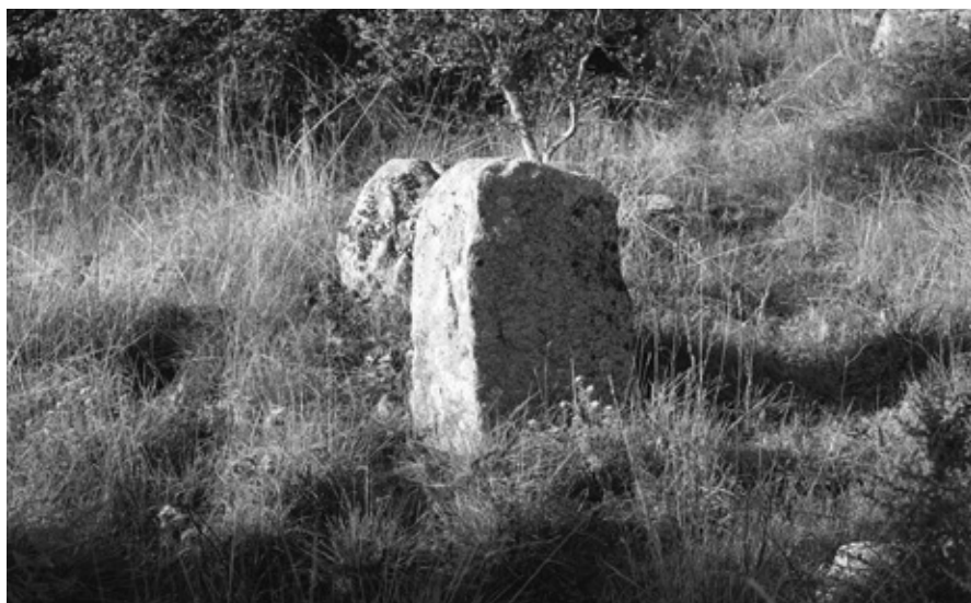
Restos de muro.