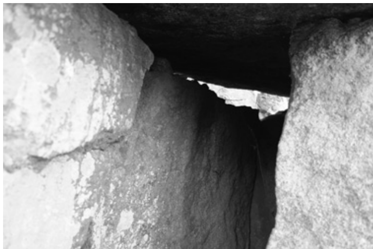
Interior de la cueva, pinturas rupestres.

Un santuario pétreo, una peña sacra –llámese resbaladera, peña de los responsos, peñas numínicas, bamboleante u observatorio, cada una con una morfología particular– son lugares cargados de simbolismo. Representa un lugar demarcado del mundo profano, un espacio común que conecta el espacio celeste con el terrestre, el mundo de los dioses con el de los hombres, un lugar, en definitiva, donde el tiempo retrocede a su dimensión mítica y primordial. Monumentos de un paisaje natural que han conservado reminiscencias de los ritos y ceremonias que allí se practicaban y que hoy celebramos en multitud de pueblos a lo largo y ancho de la geografía extremeña en forma de tradiciones ancestrales cuya memoria olvidada se pierde en el principio de los tiempos.