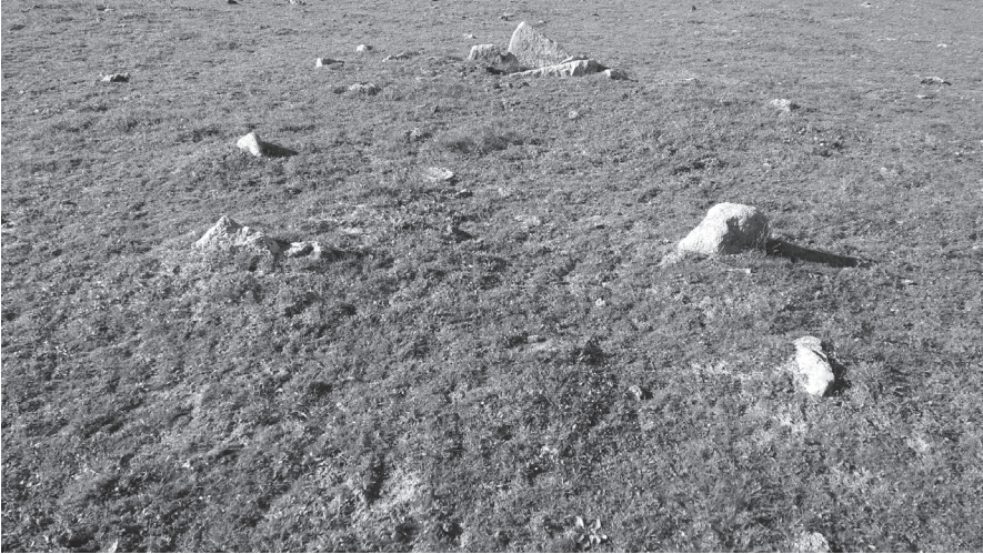
Dolmen de Montánchez.

ni en este monumento ni en los anteriormente estudiados. Hemos localizado en superficie restos de materiales cerámicos, documentados en su superficie que permite identificarlos como materiales bajo túmulo.