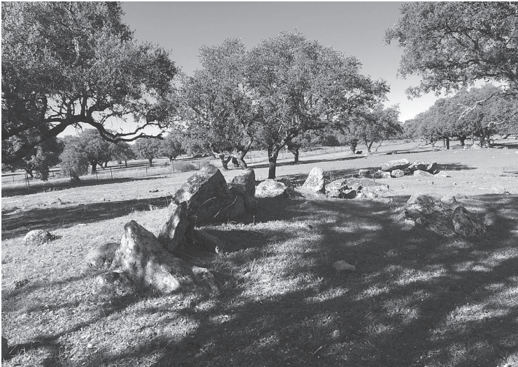
Dolmen II. El Canchal II.

En la dehesa boyal de Salvatierra de Santiago, a 1 km escaso del anterior, al lado un asentamiento presumiblemente tardorromano, a 39^{\circ} 28' 96,78'' norte y -6^{\circ} 06' 20,29'' oeste se encuentra este otro dolmen o sepultura de falsa cúpula.