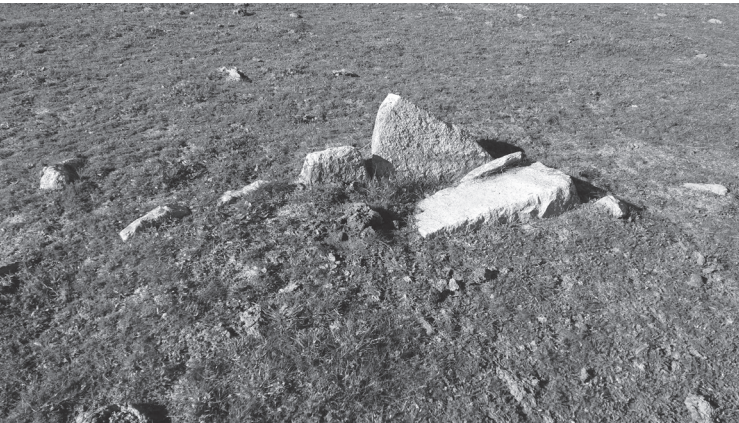
Detalle del dolmen.

Estamos ante tres interesantísimos monumentos megalíticos inéditos fechables en los inicios del IV milenio antes de Cristo.