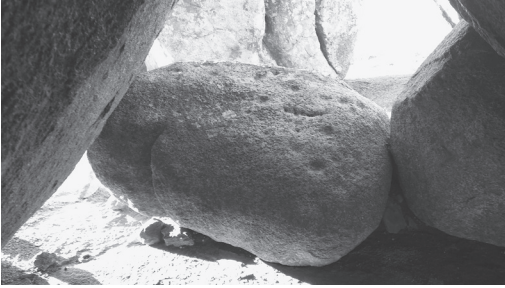
Detalle de los grabados a modo de cazoletas.

circular cubierta por un túmulo. La cámara está formada por cuatro ortostatos colocados verticalmente, y al lado, en superficie cinco ortostatos más. La planta tiende a formar un círculo y corredor formado por cuatro ortostatos clavados longitudinalmente, de menor altura que la cámara. Es un dolmen con corredor de tipo medio característico del occidente de la cuenta extremeña del Tajo, manifestando su continuidad en las áreas portuguesas y zonas donde se han localizado este tipo de arquitectura constructiva o por ejemplo en Alcántara, Valencia de Alcántara o Santiago de Alcántara.