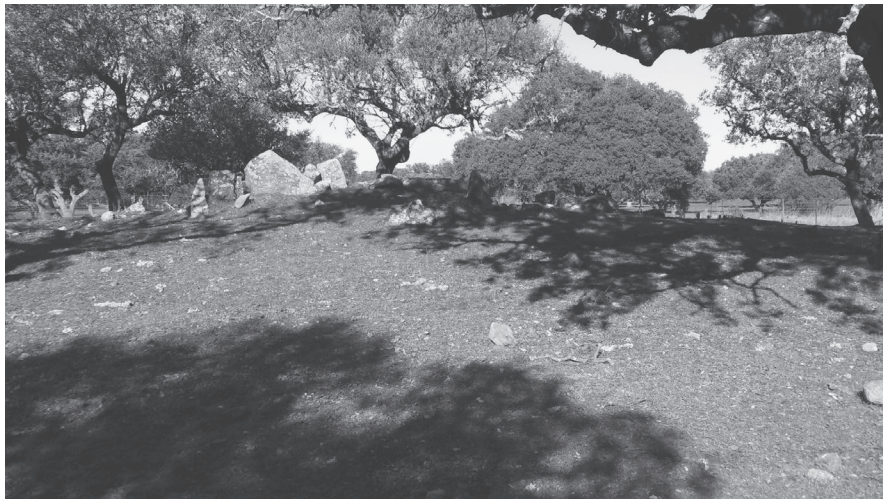
Dolmen II. El Canchal II.

El módulo de construcción de las cámaras es similar al anterior, posee corredor largo: siete ortostatos apoyados unos en otros, parcialmente tallados, como una pieza más ancha en la cabecera. La diferencia estriba en la largura del corredor que se amplía repitiendo el módulo inicial de un ortostato vertical seguido de otro horizontal. Por otra parte, la constatación de espacios trapezoidal es entre el inicio del corredor y la entrada del túmulo iguala, aún más, el sepulcro de corredor. La cámara con corredor está realizada en pizarra y granito, respondiendo a la materia prima más accesible en su entorno.