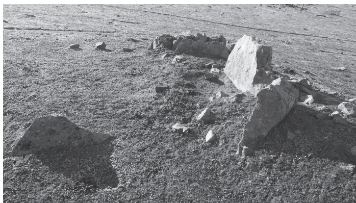
Detalle de la cimarra del dolmen, Canchal I.