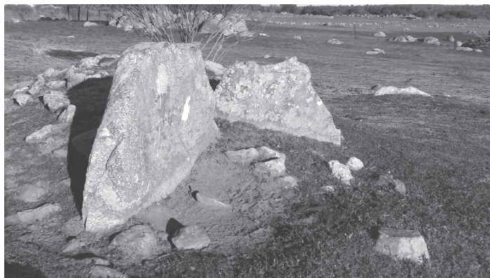
Detalle del dolmen Canchal I.