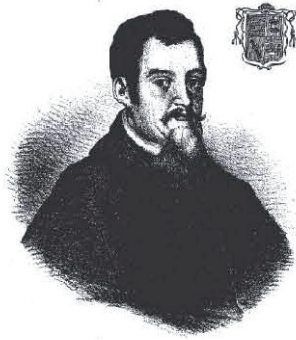
5.- D. Marcos de Torres y Rueda. Obispo de Yucatán. 20º virrey de Nueva España. (1648-1649)