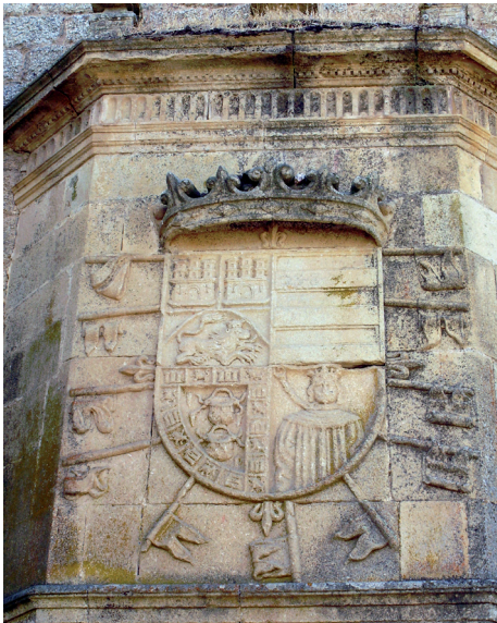
9.- Escudo de don Luis Enríquez de Guzmán, en el muro norte de la iglesia del convento de San Antonio de Padua, Garrovillas de Alconétar.

quez. Museo del Prado. Madrid. h. 1655-60