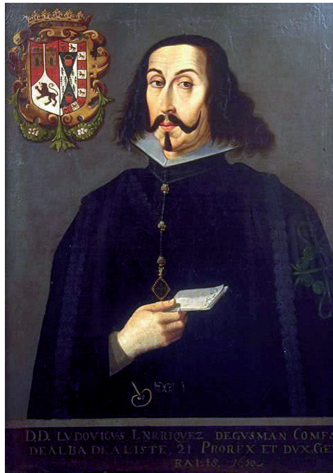
6.- D. Luis Enríquez de Guzmán. Anónimo. Museo Nacional de Historia, México, h. 1650.