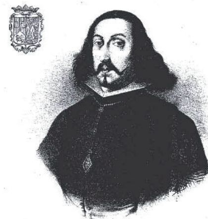
3.- D. Luis Enríquez de Guzmán, Conde de Alba de Aliste y Villaflores. 21º virrey de Nueva España. (1650-1653)