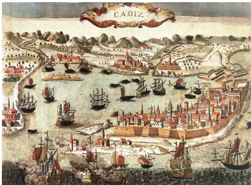
1.- Puerto de Cádiz en un grabado del Siglo XII