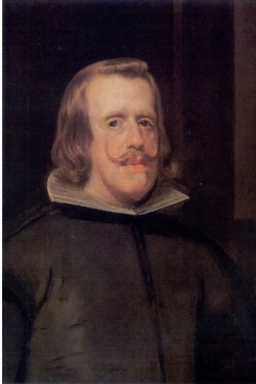
7.- Felipe IV. Diego Velázquez. Museo del Prado. Madrid. h. 1655-60