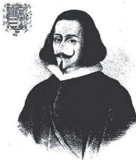
4.- D. García de Sarmiento de Sotomayor, Conde de Salvatierra. 19º virrey de Nueva España. (1642-1648)