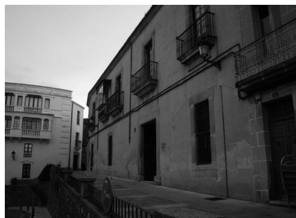
Palacio del Vizconde de la Torre de Albarragena. Cáceres.