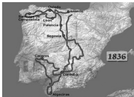
Expedición Del General Gómez (Web del Museo Zumalacárregui. Guipúzcoa).

Durante el paso y permanencia del general no hubo que lamentar desgracias personales. Pascual Madoz 24 nos manifiesta que Gómez tuvo a gala un loable gesto, de los que tanto le distinguieron, dando libertad a un crecido número de prisioneros después de prestarles juramento de no volver a las armas contra la causa de D. Carlos, haciendo así honor a su personalidad que contrasta con el comportamiento que solía tener Cabrera, mas cruel y con el apelativo de sanguinario.