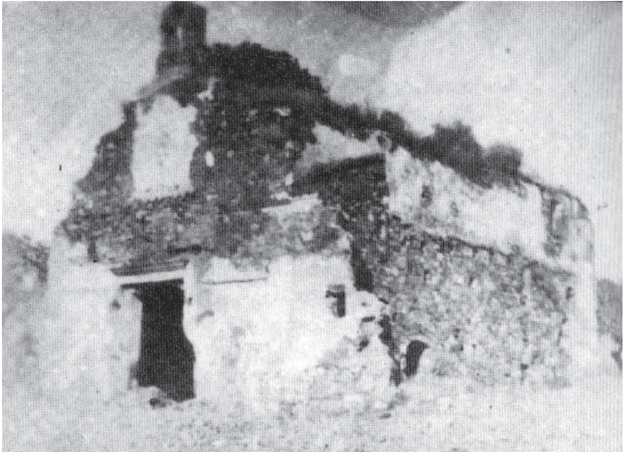
Casa de la Encomienda en los Villares de la Alameda 13

dicha dehesa las riberas de pequeños ríos, que bajan de los términos de los Santos y Zafra y Guadajira, que nace en el término de Salvatierra, pasa por el de Feria, sigue de linde al de Zafra y se introduce en el de la Fuente, juntándose en la Alameda. Dichas tres riberas y la dicha dehesa de la Alameda pertenece al hospital de Santiago de Toledo y es de puro pasto, con su casa, como va dicho, y huerta que están distantes de Zafra más de legua y media».