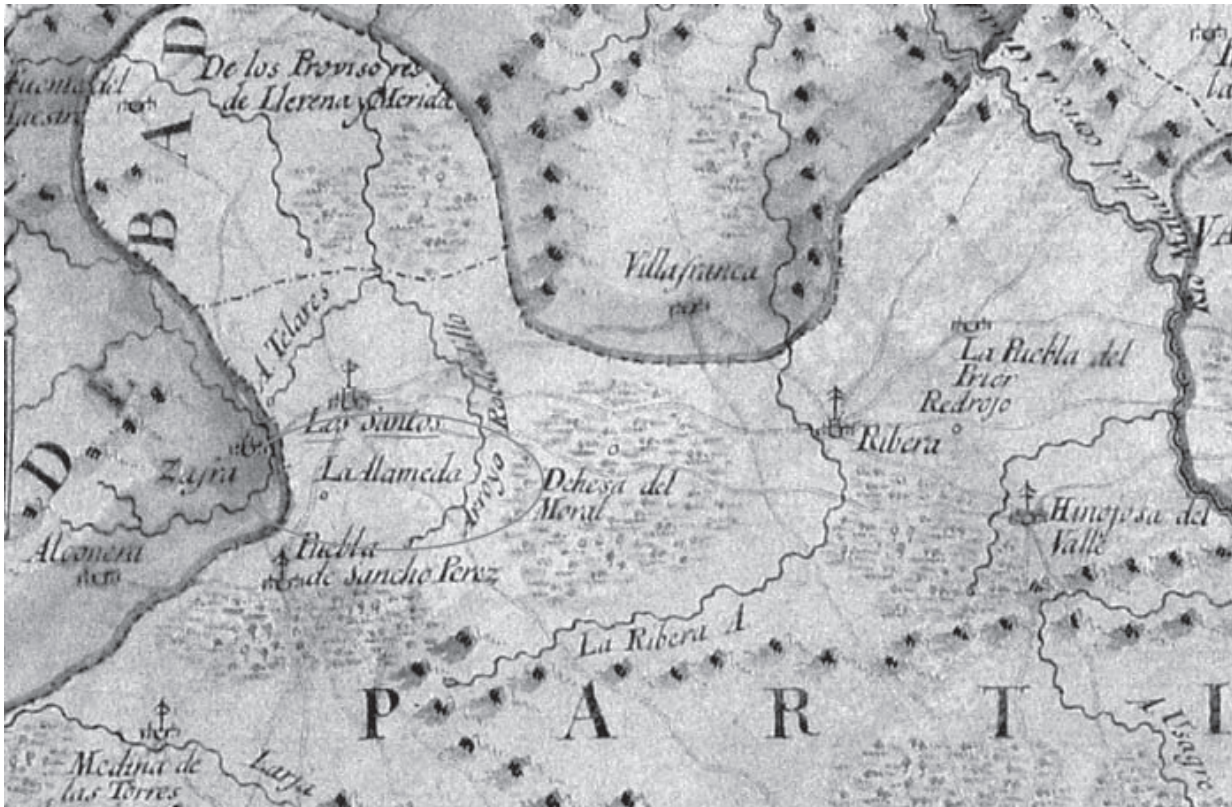
Detalle del Mapa Geográfico del Partido de Llerena, Tomás López (1782) (CENTRO GEOGRÁFICO DEL EJÉRCITO. CARTOTECA HISTÓRICA, Mapas de Extremadura, n° 106)

juicio de este vecindario y de donde procede su deplorable estado y las esterilidades que ha padecido y padece de trigo y cebada, de que podría restablecerse bolbiéndose a constituir dicha dehesa a su naturaleza de pasto y labor como siempre estuvo hasta que entró el mesteño; sin que se dude que estos vecinos tengan derecho labrar y pastar con sus ganados en dicha dehesa porque tienen condominio efectibo en ella, cuyos efectos han sido siempre y son el derecho de segar yerba con jizino para manutencion de sus ganados de labor, el de cortar cardos con sacho y desquaxar leña con azadon, y el de pastar en qualquiera estacion del año las cavallerias menores de estos vecinos sueltas y las mayores atadas a estaca y con una sogas de ocho varas de largo con facultades a mudarlas, de modo que el concepto comun es que labrandose y aprovechandose con sus ganados por estos vecinos, lograrían los mayores aumentos y facilidades.»