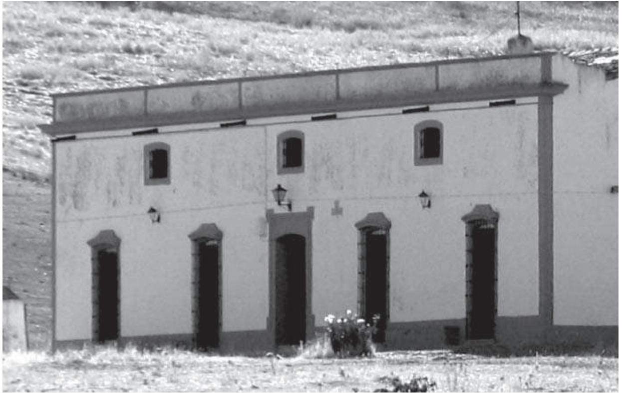
Cortijo de la Alameda. Vivienda principal.