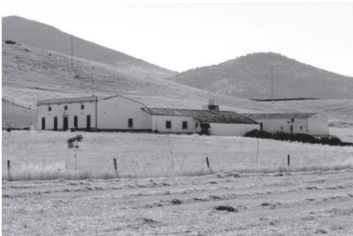
Cortijo de la Alameda. Visión general.

Ya en el Nomenclátor de 1863 6 se recogen los cortijos y casas de campo de Cantarote, Las Cañas, Casablanca, Casa de Becerra, Casa de Diego Adame, Cortorrillo, Los Gramadales, La Heredad, Los Horneros, Huerta de Arriba, Ladera, La Mesa, La Muela, Los Naranjos, Palomar, El Portal, Portezuelo, Potril, Prado, Rascón, Salguero, Los Silos, Veldeginete y La Viña.