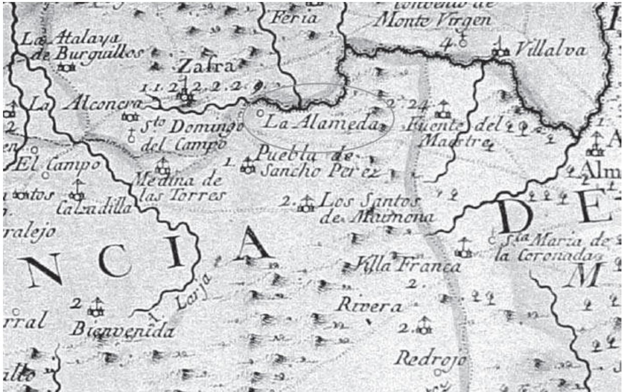
Detalle del Mapa de la Provincia de Extremadura, Tomás López (1766) (CENTRO GEOGRÁFICO DEL EJÉRCITO. CARTOTECA HISTÓRICA. Mapas de Extremadura, n° 2).

En el Interrogatorio de la Real Audiencia , fechado por los mismos años, se nos informa asimismo del terreno como tal hablándose de su extensión o propiedad así como de las disputas que en parte existían entonces sobre la Alameda. Dice así 17 :