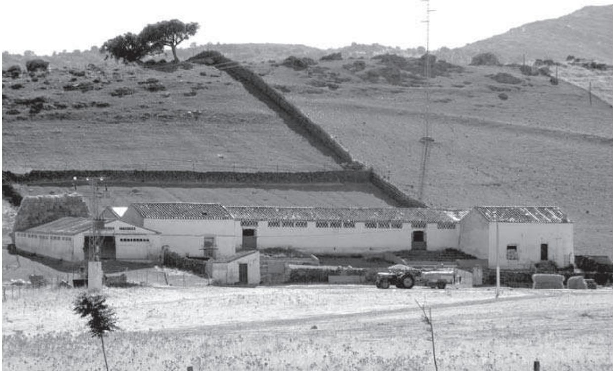
Cortijo de la Alameda. Dependencias agropecuarias.