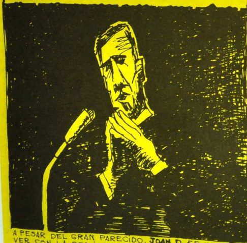
A PESAR DEL GRAN PARECIDO, JOÁN D. ES UN PERSONAJE DE FICCIÓN QUE NADA TIENE QUE VER CON LA REALIDAD.

PARA JOÁN DELÓN TODAS LAS PALABRAS SIGNIFICABAN LO MISMO SONIDOS GUTURALES A LOS QUE HABÍA QUE DAR MAYOR Ó MENOR INTENSIDAD CONFORME SE DESLIZABAN DE LAS CUERDAS BUCALES A LOS LABIOS.