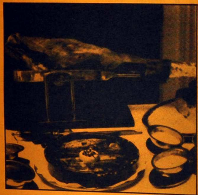
mucho; guiso con una particularidad no conocida jamás en otras tierras, como es la de que se cuecen las carnes con leche en vez de con