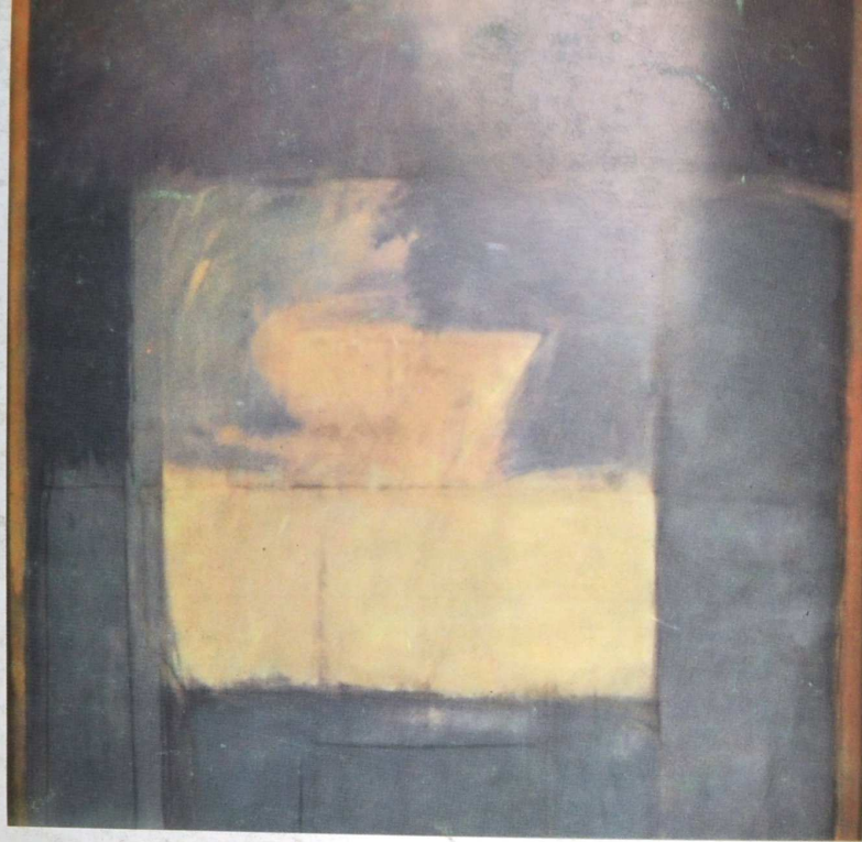
"INTERIOR BLAU" de Alberto Rafols.