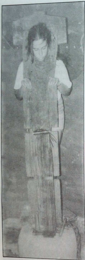
Sala de la Inquisición. Aparato de tortura.