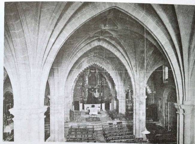
Bravo sobre otro templo románico, adosado al castillo-fortaleza que ya existía en 1235.

Hay que visitar en Valencia de Alcántara el templo de Romacador, joya arquitectónica de estilo gótico; construido en el siglo XVII por el arquitecto Juan