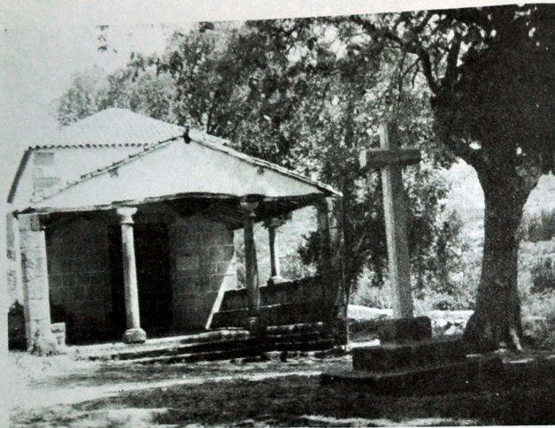
En la Sierra de Gata