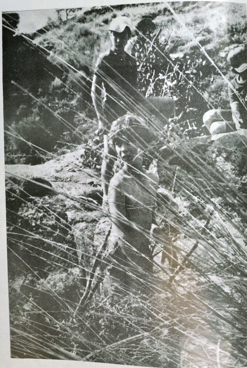
El Príncipe Felipe acampó en Villanueva de la Vera