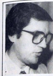
Por Juan de la Cruz GUTIERREZ GOMEZ

PITA.—Pero hay que conseguir la unión de los ganaderos. Hay que conseguirla, no solamente para que logren mejores precios en la compra del pienso, sino para llegar a una comercialización adecuada del producto. De-