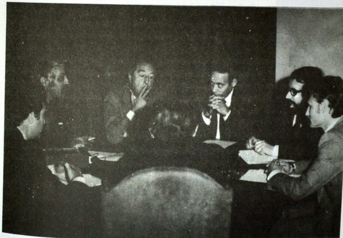
RABANAL: CACERES, PROVINCIA AHORRADORA

No hay turnos rigurosos ni ordenados de intervención. Cada cual toma la palabra cuando quiere, si quiere, y la suelta cuando lo cree oportuno. La única mínima regla de juego es que se hable del aproximadamente tema propuesto. Lo que los norteamericanos llaman una tormenta de ideas.