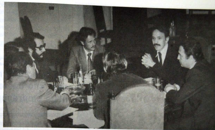
CACERES Y LA BANCA PRIVADA

tricas. Pero de esos 14.000 millones de pesetas que se invirtieron en hacer. No me explico por qué no ejercen esos derechos.