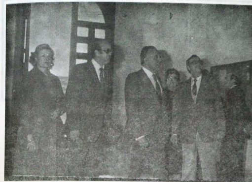
El ministro, con el presidente de la Diputación, visitó San Francisco

Constitución, dejará el protagonismo cultural a las comunidades autónomas que lo quieran asumir. La presencia del Estado se constatará principalmente a través de las bibliotecas provinciales y las nacionales.»