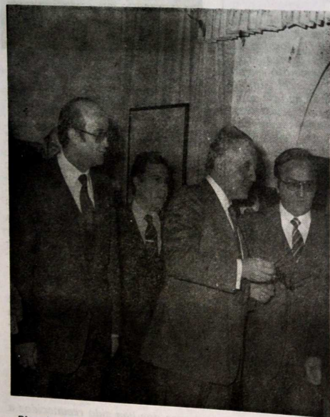
Ricardo de la Cierva en su visita a la Exposición de pintura del Premio Cáceres

Convocados los Premios "CACERES" de ESCULTURA (1.000.000 de Ptas.) y NOVELA CORTA (500.000 Ptas.)