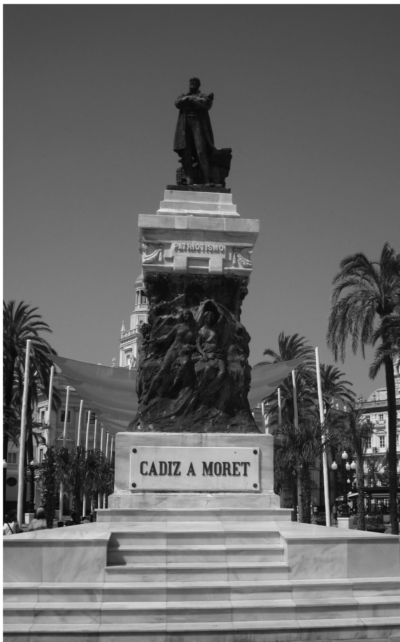
Figura 3. Monumento a Moret, en la remodelada plaza gaditana de San Juan de Dios (antes, plaza de Isabel II).