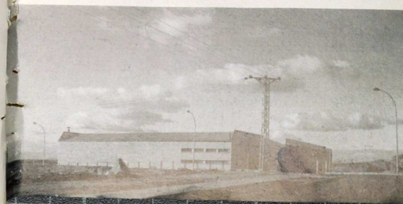
Vista parcial del Polígono Industrial "Las Capellanías" de Cáceres, y panorámica de la Factoría CAELSA, de caucho de precisión, primera fábrica en él instalada