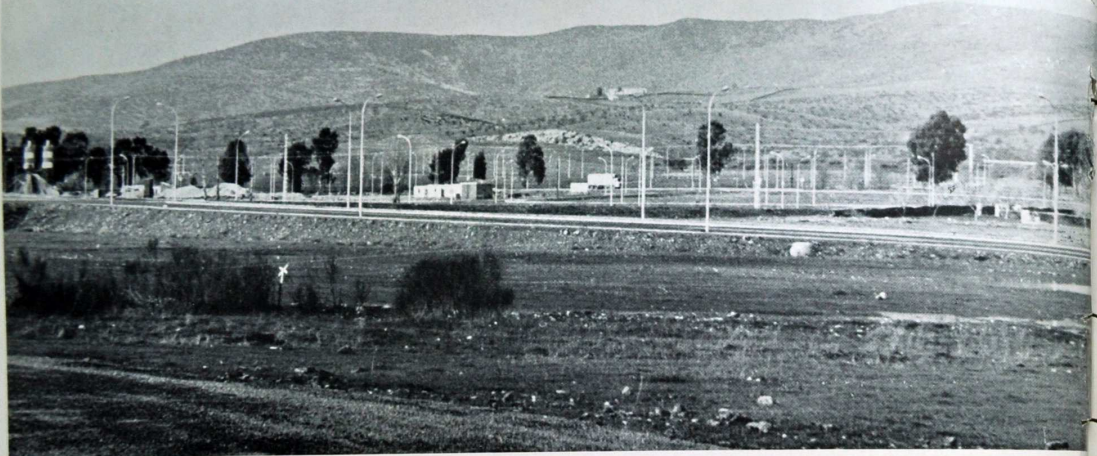
Perspectiva del Polígono Industrial de Plasencia, situado sobre la CN-630, a dos kilómetros de la Ciudad