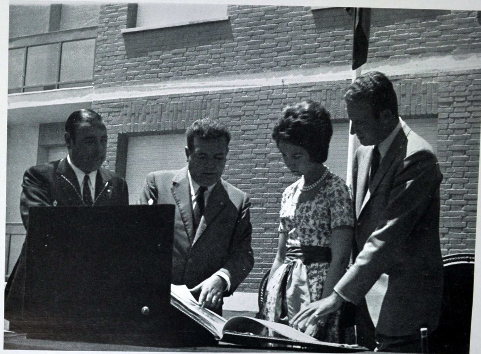
Los Príncipes de España y las autoridades en Plasencia, con motivo de la inauguración de viviendas