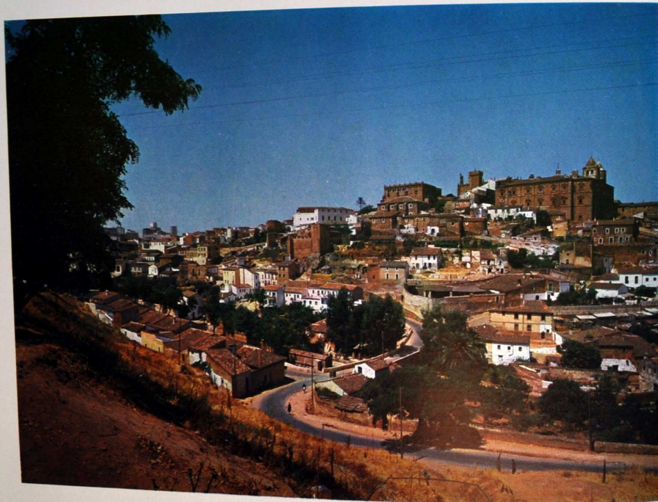
Vista panorámica del Cáceres antiguo

Francisco. Frontera con la Ruta Corta, resalta en ella su suntuosidad y belleza y perfecta armonía, que le comunican sus calificados trazos y la variedad jardinera y exótica y del país del gusto más exigente. A su alrededor ampliar zonas verdes que se extienden hasta la Alameda, Parque de España y Parque de las Ranas en posición limítrofe con la travesía a Portugal, dan un bellissimo aspecto al sector que puede considerarse el principal del casco urbanizado.