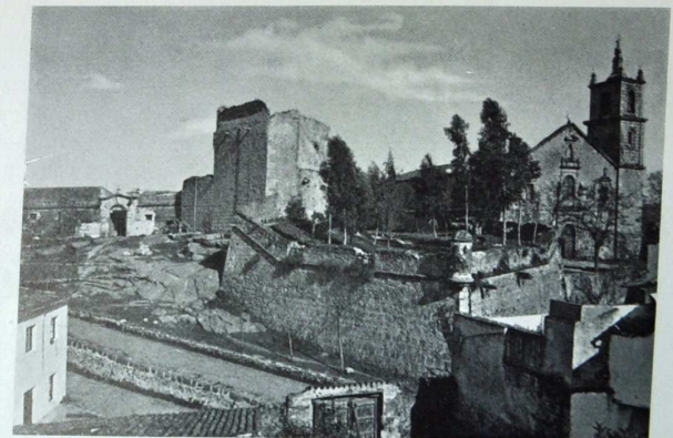
Valencia de Alcántara. Castillo e Iglesia Arciprestal de Rocamador