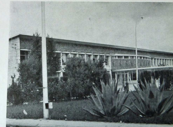
Sanatorio Psiquiátrico. Pabellón infantil

recer la Diputación Provincial de Cáceres de este centro y así han aparecido en el corto espacio de tres años: nuevos quirófanos, modernos y bien dotados, salas de recuperación perfectamente acomodadas, nuevas salas de enfermos, nuevas salas de maternidad con todos los adelantos, aparecen habitaciones individuales —no existían—, se hacen más fáciles los accesos y, lo que es mejor, se sigue, hasta una total reforma en consonancia con los conceptos nuevos de la medicina hospitalaria.