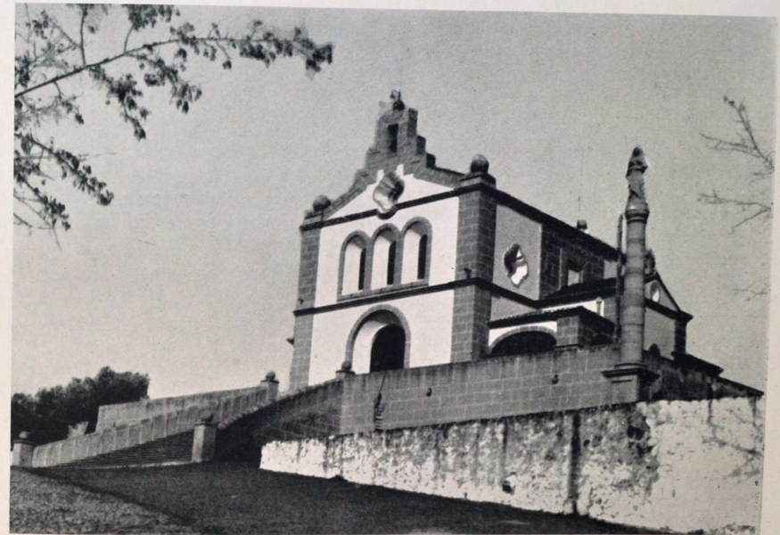
Valencia de Alcántara. Ermita de Ntra. Sra. de los Remedios

jada de hechos históricos que patentiza el temple de los valencianos. A la derecha, en solitario y majestuoso pedestal de roca la ermita de la Patrona Virgen de los Remedios, bendice a la villa y preside su laboriosidad.