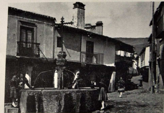
Guadalupe. Fuente de los Tres Chorros (siglo XV)