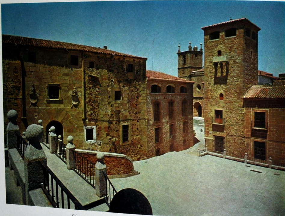
Cáceres. Vista monumental desde la Plaza de San Jorge