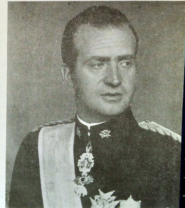
Juan Carlos I