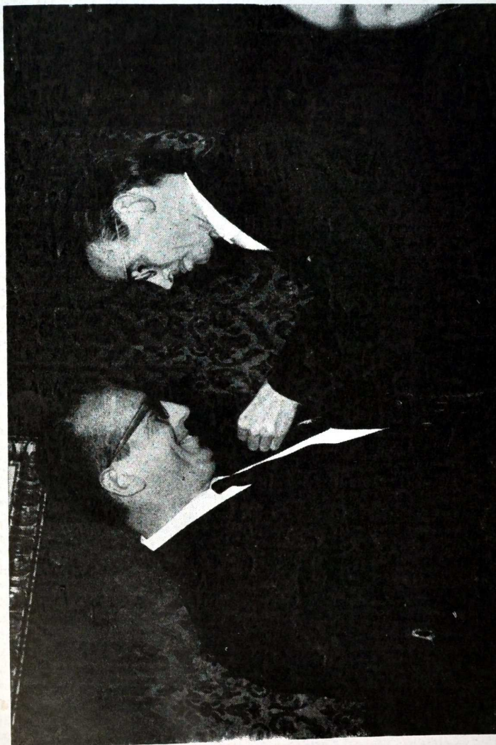
Imposición de la Medalla de Oro de la provincia, al Sr. Romeo Gorría, Ministro de Trabajo, en la Diputación Provincial de Cáceres (27-IX-65)

Y lo diré así, y lo diré así, además, dentro de muy poco, porque todos los Ministros de Trabajo, por primera vez en la historia de las relaciones nuevas de América y España, el día veinte se reúnen con el Ministro de Trabajo en la fecha señalada por él. Yo les llevaré este mensaje, el que ahora mismo me estáis inspirando vosotros, y les hablaré de la Universidad Laboral Hispanoamericana de Cáceres, pero esta empresa no es mía sola, esta empresa es de todos: todos están implicados aquí; yo solo no puedo ni siquiera con mis colaboradores, llevar sobre el peso de mis hombros, esta subyugante empresa en la que nos hemos embarcado,