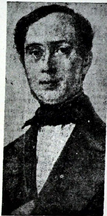
Don Juan Donoso Cortés, Marqués de Valdegamas; ilustre extremeño a quien con motivo de su Centenario se rinde fervoroso homenaje

Pero ninguna de tales apreciaciones, concreción más o menos justa de apasionamientos pasajeros; ni las citas que Edmund Jorg traslada a las Historisch-politischen Blätter en el decenio de su muerte, ni la momentánea actualidad despertada por la publicación en París en 1880 por Adhemar d'Antioche de las cartas cruzadas entre Donoso y el conde Raczyński, dan a los alemanes visión cabal del genial paisano nuestro. La traducción misma del Ensayo , vertido en 1854 por Carl B. Reiching desde el texto francés, al cual además supone el original, adolecía de tan graves faltas que resultaba inaccesible testimonio de lo que Donoso representó en la coyuntura decimonónica europea. Para el tudesco medio tratábase de un gran polemista católico, atado a la intransigencia más extrema, robustísimo de inteligencia y sagacísimo en perfilar los males de su siglo; pero por lo mismo exagerado hasta lo cerril, intransigente hasta lo fanático, estrechador de su natural talento hasta extremos de anulación y sólo diagnosticador, nunca terapeuta, de las enfermedades de la sociedad